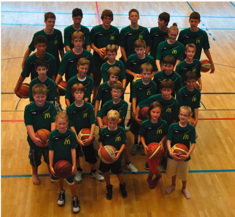
Von U10 bis U17 gab es die neuen neuen Warm Up-Shirts für unsere Talente