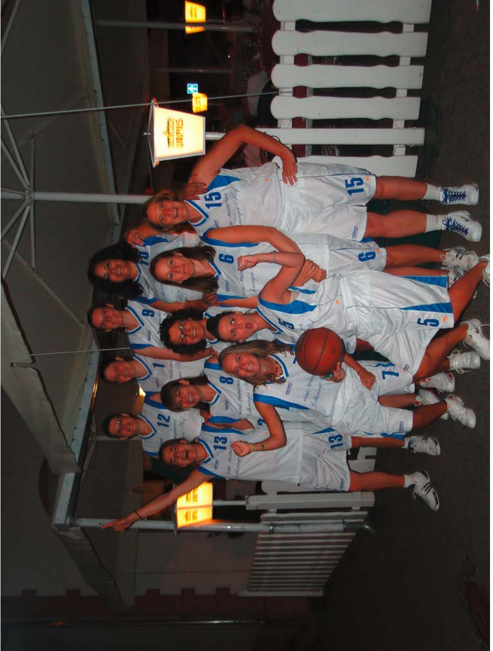
Unsere Damenmannschaft bei der Meisterschaftsfeier